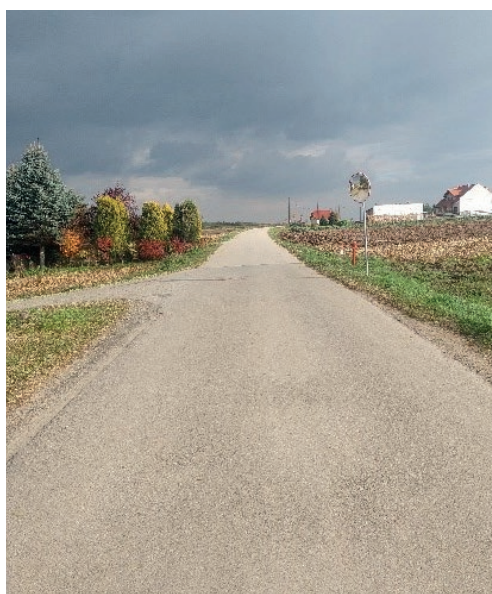
Fundusz sołecki Rudno Dolne