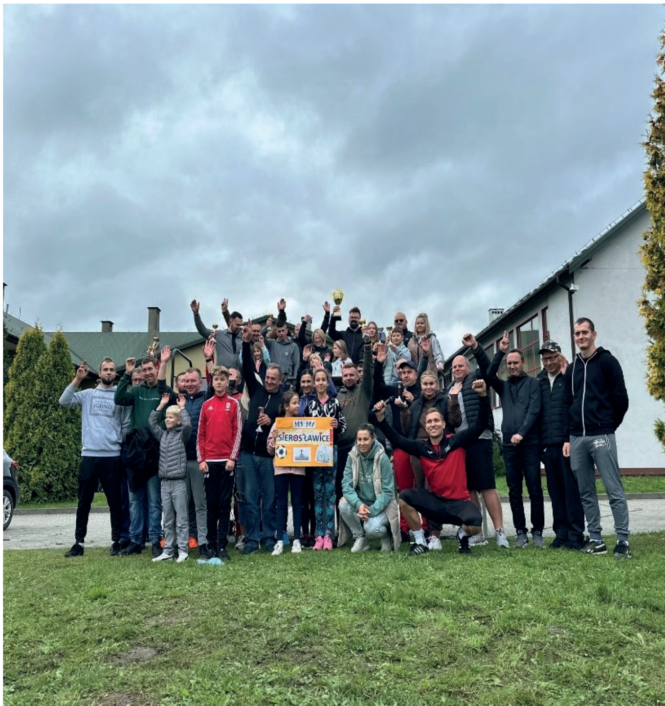
Konfrontacja Sołectw i Miasta

„Gazeta Nowobrzewska” – magazyn samorządowy Gminy i Miasta Nowe Brzesko