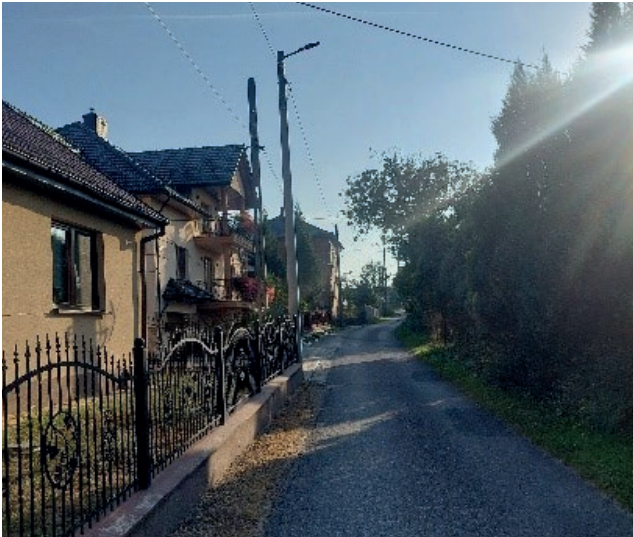
Fundusz sołecki Majkowice