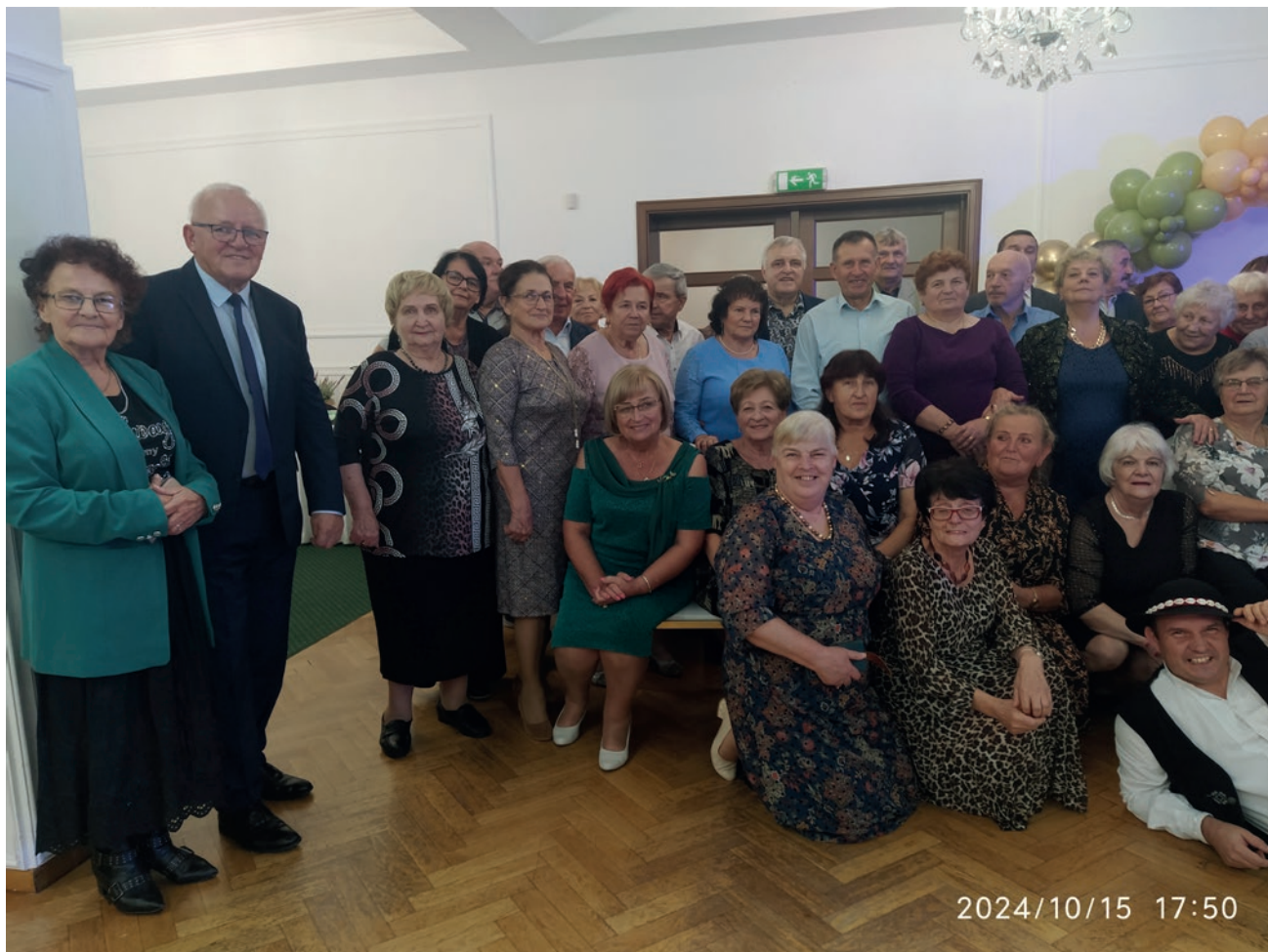
Dzień Seniora 2024

Z okazji nadchodzących Świąt Bożego Narodzenia, Zarząd Koła pragnie złożyć najlepsze życzenia. Życzymy, aby ten czas był pełen radości, bliskości i ciepła rodzinnego, spędzony w dobrym zdrowiu i miłej atmosferze.