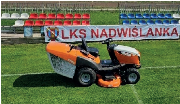
Fundusz sołecki Nowe Brzesko Nadwiślanka