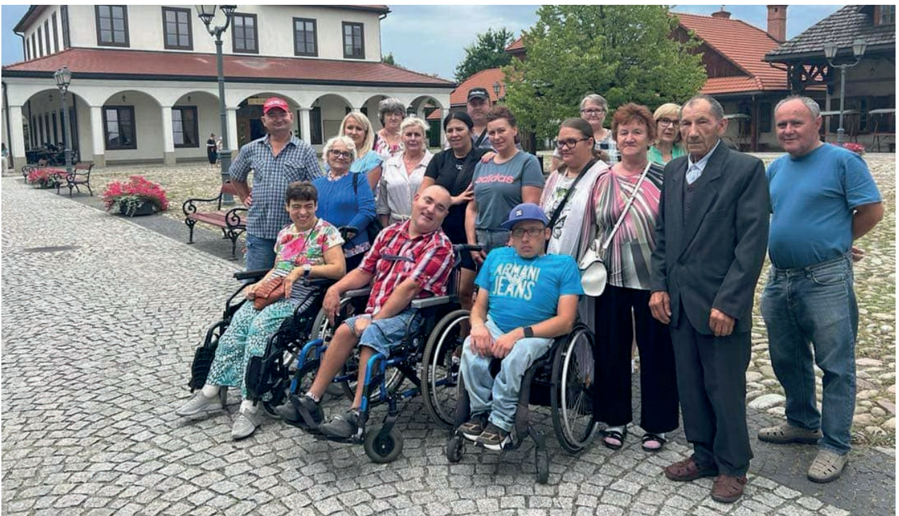
Uczestnicy ŚDS w miasteczku galicyjskim – Nowy Sącz

XI Piknik Integracyjny Osób Niepełnosprawnych został dofinansowany ze środków Państwowego Funduszu Osób Niepełnosprawnych, będących w dyspozycji Starostwa Powiatowego w Proszowicach. Wsparcie w zorganizowaniu Imprezy udzielili nam również: