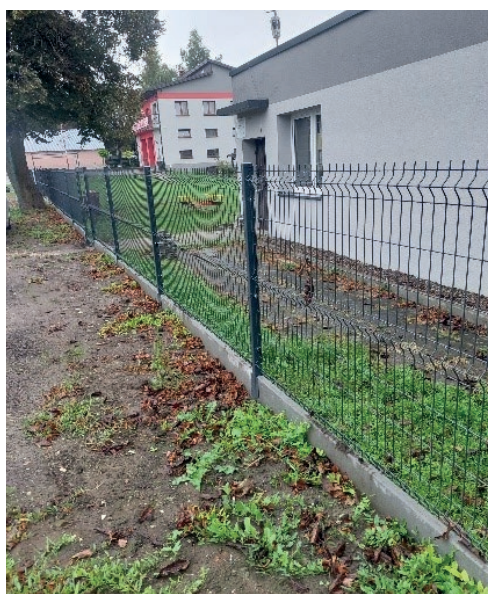
Fundusz sołecki Śmiłowice