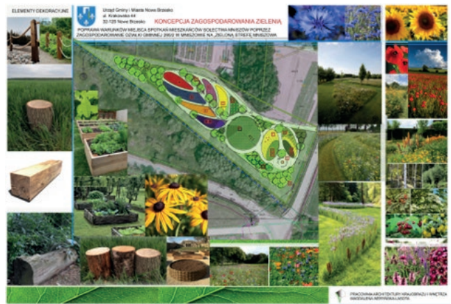
Fundusz sołecki Mniszów