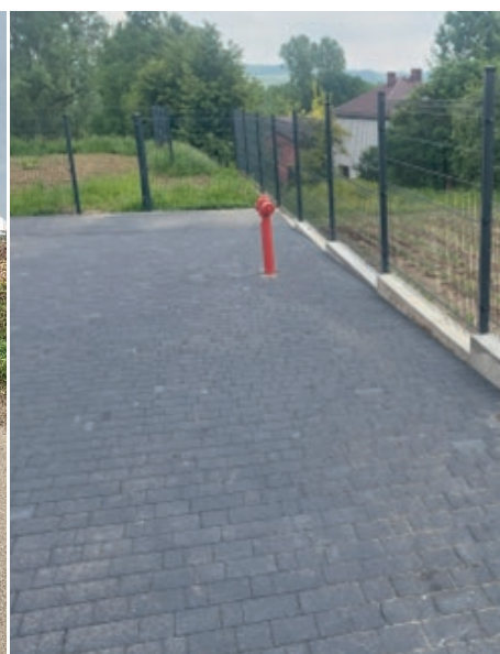
Fundusz sołecki Kuchary