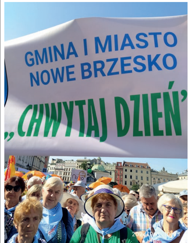
Krakowskie Senioralia 2024

Koło Emerytów, Rencistów i Inwalidów w Nowym Brzesku liczy obecnie 69 członków i działa aktywnie na rzecz Seniorów. Organizujemy spotkania koleżeńskie, noworoczne, andrzejkowe, Dzień Seniora i inne. Wyjeżdżamy na wycieczki, koncerty, do kina, na Międzynarodowe Senioralia, do teatru w Cieszynie. Integrujemy się z innymi kołami jak Koszyce, Wawrzeńczyce, Proszowice, poprzez wspólne wyjazdy. Członkowie naszego koła korzystają z ofert Oddziału Rejonowego w Proszowicach takich jak wycieczki krajowe i zagraniczne, wyjazdy na baseny termalne, koncerty i wiele innych. Staramy się zainteresować jak najwięcej seniorów atrakcyjnymi propozycjami spędzania wolnego czasu, zachęcić do aktywności, do kontaktów