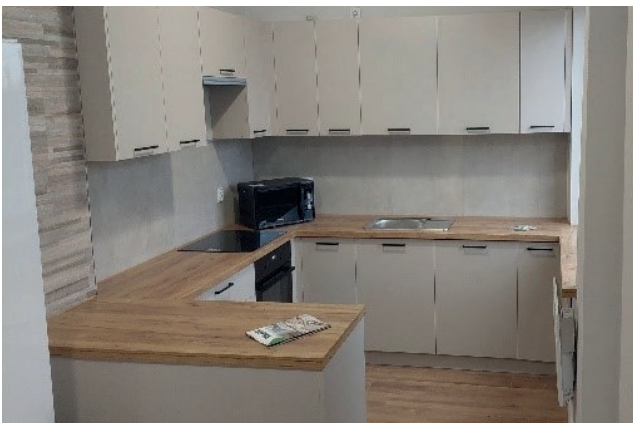
Fundusz sołecki Mniszów Kolonia