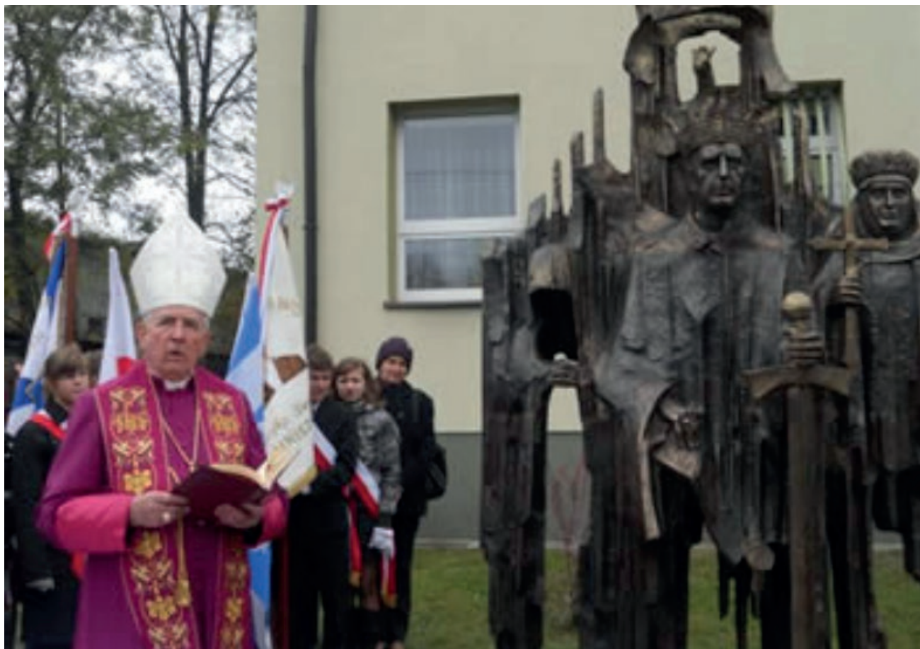
Poświęcenie pomnika Bolesława Wstydlivego