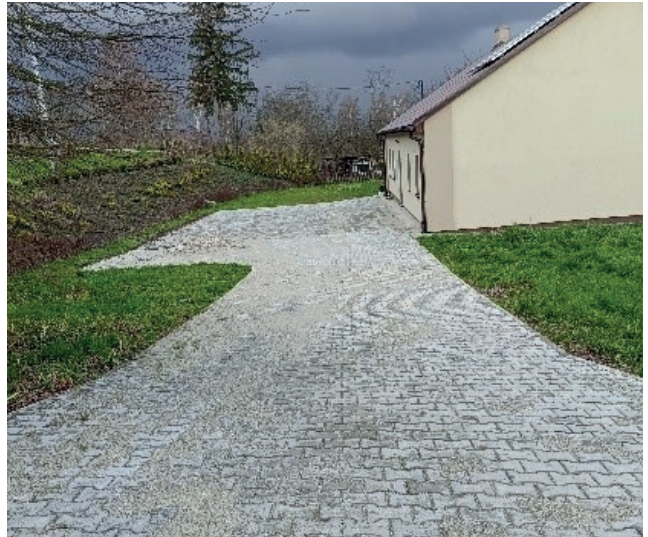
Fundusz sołecki Grębocin