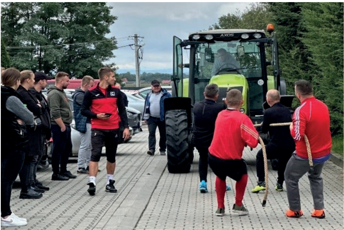
Konfrontacja Sołectw i Miasta

Najlepszym sołectwem Gminy i Miasta Nowe Brzesko okrzyknięte zostało sołectwo ŚMIŁOWICE. Dziękujemy Organizatorom – Sołectwu Sierosławice za przygotowanie wydarzenia oraz wszystkim uczestnikom za świetną zabawę. Do zobaczenia w przyszłym roku. ■