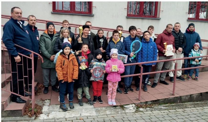
Uczestnicy zawodów strzeleckich