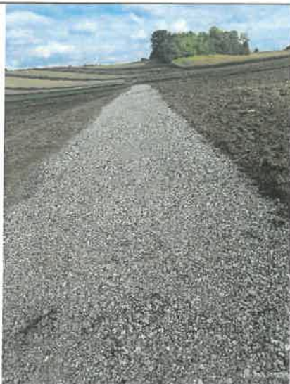
Remont drogi w Kucharach