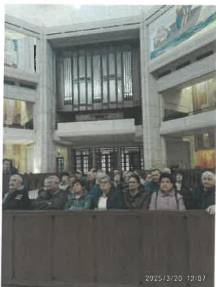
Koło Emerytów, Rencistów w Centrum Jana Pawła II