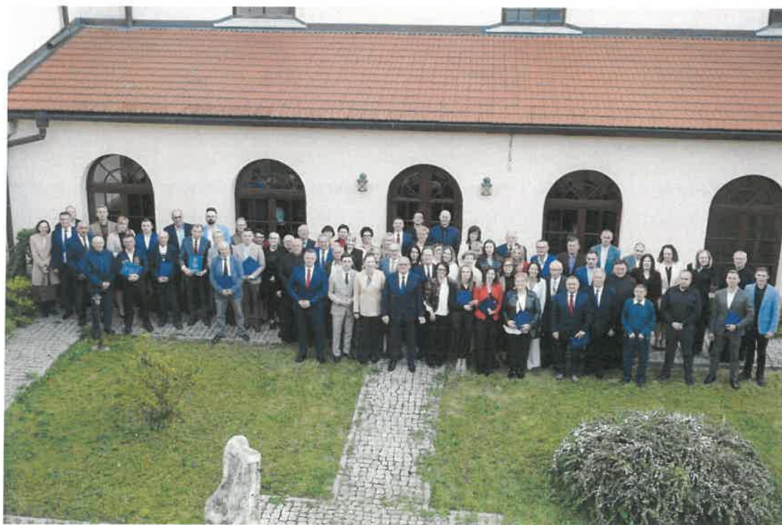
Pamiątkowe zdjęcie Uczestników obchodów 35 - lecia samorządu