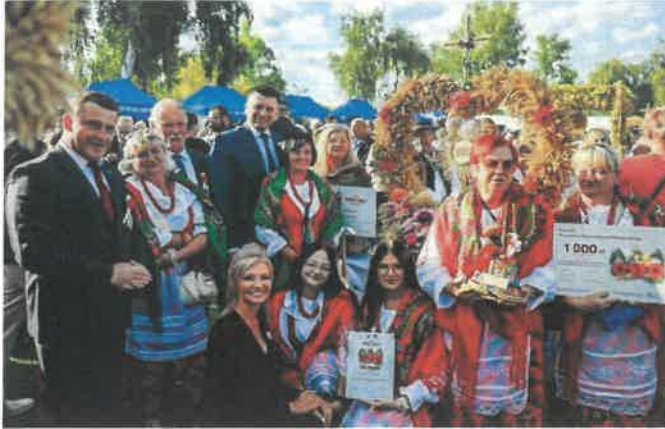
Stowarzyszenie KGW Hebdów na Dożynkach Wojewódzkich