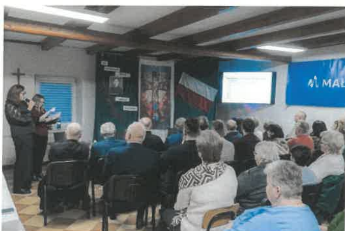
Stowarzyszenie na rzecz rozwoju wsi Grębocin - Konferencja naukowa poświęcona postaci księdza Stanisława Rojka