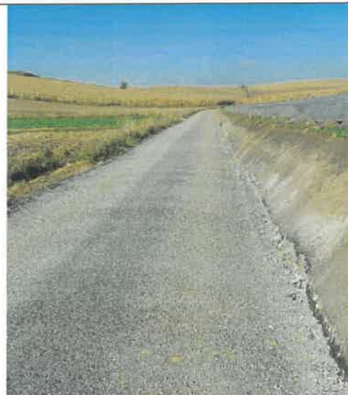
Droga gminna nr 160639K w miejscowości Przybysławice i Rudno Dolne