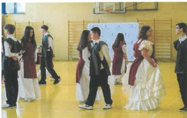
Prezentacja tańca dworskiego