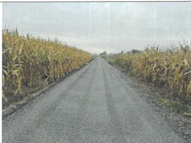
Droga gminna „Mniszów Kolonia do pól”