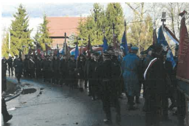
Dzień Pielgrzyma - Pielgrzymka Strażacka - Druhny i Druhowie przed wejściem do Sanktuarium Matki Boskiej Hebdowskiej