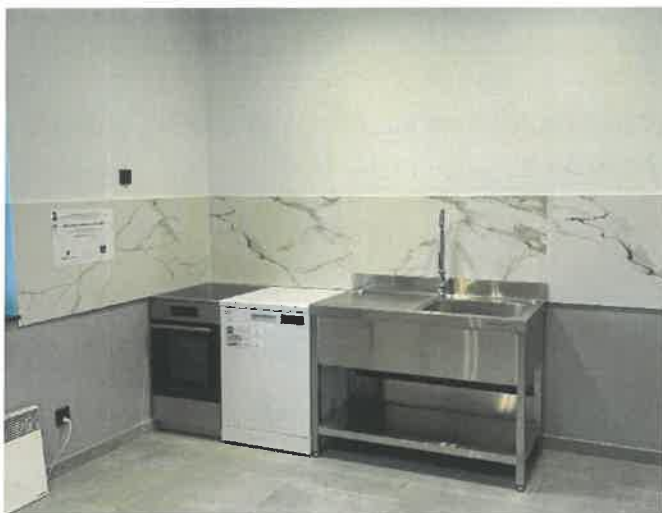
Wyremontowana kuchnia w świetlicy wiejskiej w Kucharach

17) Wykonano remont instalacji elektrycznej w budynku magazynu przeciwpowodziowego w Hebdowie, koszt netto 3.500,00 zł, brutto 7.381,00 zł.