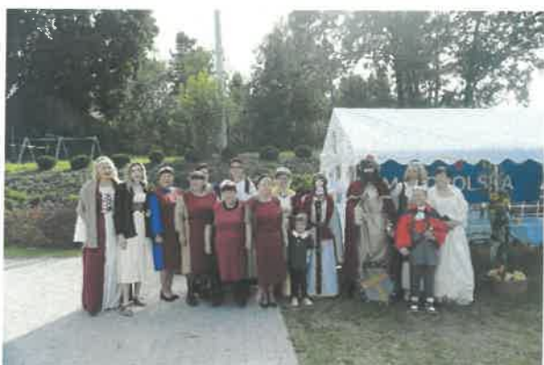
Stowarzyszenie na rzecz Rozwoju wsi Grębocin - Projekt Piastowie uczują w Grębocinie