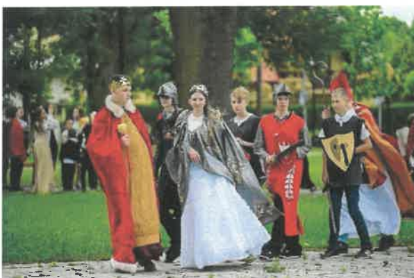
Przejście Orszaku Dworskiego

Projekt dofinansowany z budżetu Urząd Marszałkowski Województwa Małopolskiego oraz budżet Gminy i Miasta Nowe Brzesko.