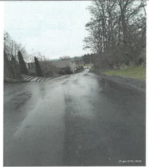
Remont zjazdu w Przybysławicach