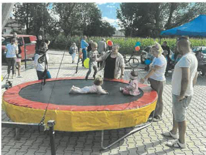
KGW Pławowice - Piknik Rodzinny

Piknik Rodzinny – dofinansowanie z budżetu Gminy i Miasta Nowe Brzesko.