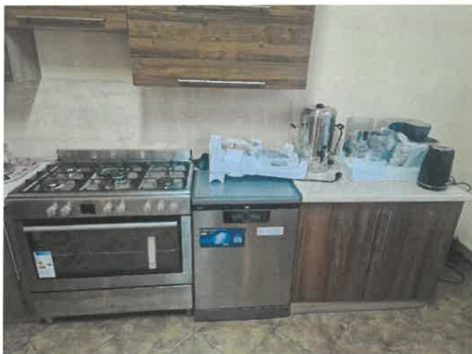
Sprzęt AGD zakupiony do świetlicy wiejskiej w Przybysławicach