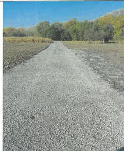
Droga gminna „Rudno Dolne Józefów do pól_1”